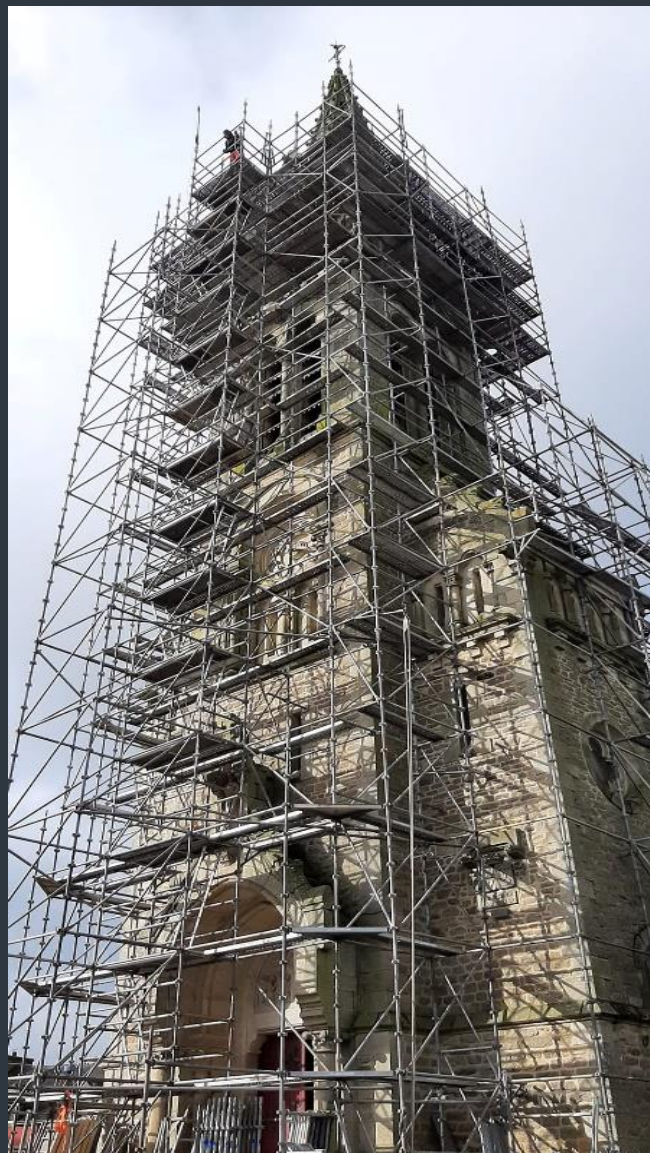
TRAVAUX DE RÉFECTION DU CLOCHER